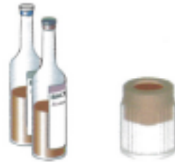
HEMOCULTURES OU PURGE